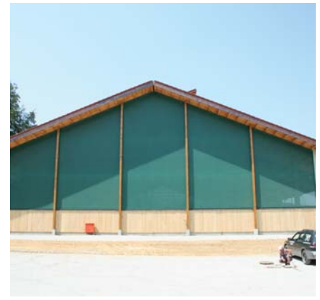
In der Reithalle und im Stallbereich wurde viel mit Windschutznetzen gebaut.

harmonie gelegt: „Die Pferde müssen sich immer ausweichen können, es darf keine Ecken und Sackgassen geben.“ Zur Eingewöhnung in die Gruppe und für Pferde, die sich nachts zurückziehen können sollen, stehen Boxen neben dem Liegebereich bereit.