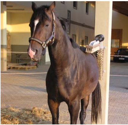
So lässt's sich aushalten: Licht, Luft, Bewegung und eine Kratzbürste.