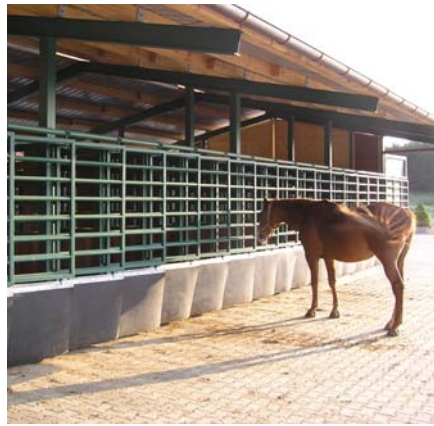
Genial einfach: Die Fressstände können von Hand zugeklappt werden.